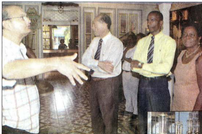
Au musée du rhum, les élus ont découvert la nouvelle maison de la distillation.